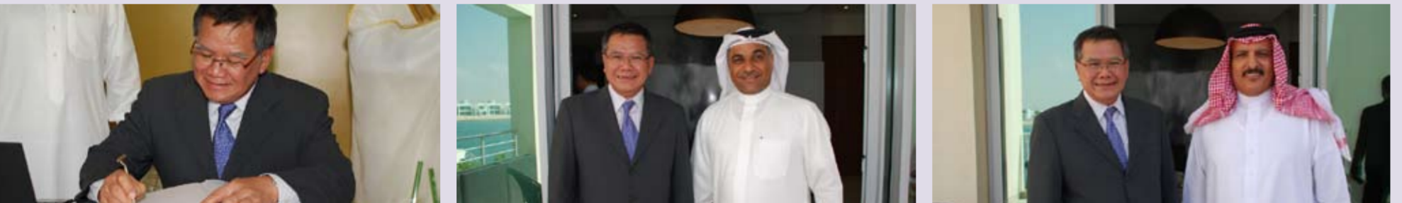
Parliament members from Singapore pay a visit to Durrat Al Bahrain.