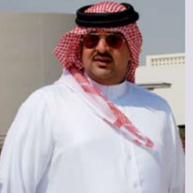
HRH Shaikh ABDULLA BIN HAMAD AL KHALIFA, the southern governor of the Kingdom of Bahrain, visits DAB.

درة البحرين ترحب بالشيخ عبد الله بن حمد DAB WELCOMES HRH SHAIKH ABDULLA BIN HAMAD قام الشيخ عبد الله بن حمد، وهو أحد رواد درة البحرين، بزيارة الموقع وبعض الفيلات المخصصة للعرض.